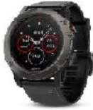
Handgelenks- computer SUUNTO