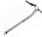
Eispickel EDLRID Raid