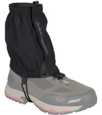
Gamaschen SEA TO SUMMIT Gaiters

Für die meisten Touren gilt: Weniger ist mehr. Denn ein unnötig schwerer Rucksack kann den Erfolg deiner Tour gefährden. Die aufgeführte Ausrüstung solltest du bei jeder Unternehmung dabei haben: