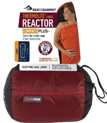
Hüttenschlafsack SEA TO SUMMIT