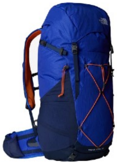
Rucksack THE NORTH FACE Trail Lite 36