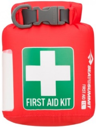
Erste Hilfe Set mit Blasenpflaster, Aspirin u.ä.