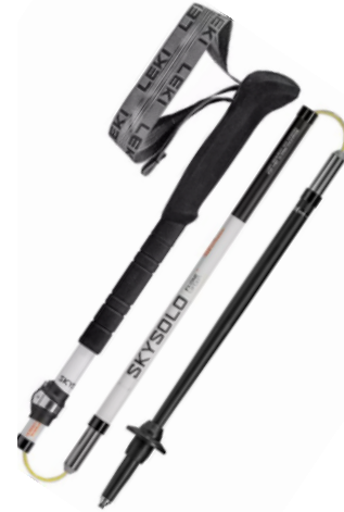
Teleskopstöcke LEKI Skysolo