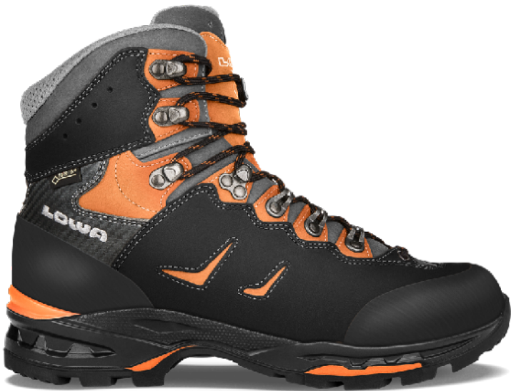
Der perfekte Allrund Bergschuh: LOWA Camino GTX

Bergschuhe sind der wichtigste Ausrüstungsgegenstand für deine Bergtouren. Wir empfehlen dir, nur bewährte und hochwertige Produkte zu verwenden. Deine Bergschuhe sollten perfekt passen und über eine stabile Sohle verfügen.