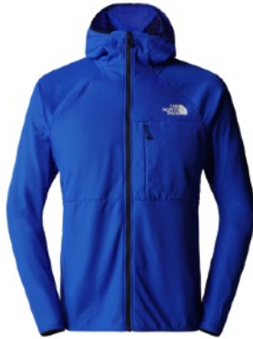
Midlayer THE NORTH FACE Future Fleece