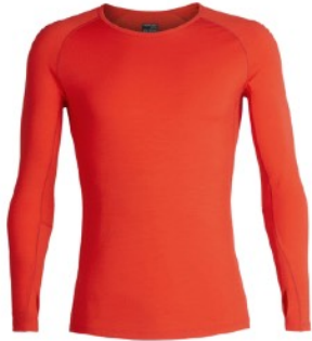
Baselayer ICEBREAKER Merino