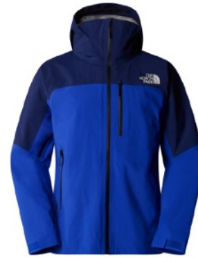
Hardshell THE NORTH FACE Torre Egger