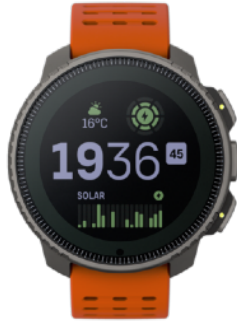
Handgelenks- computer SUUNTO