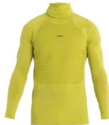
z.B. ICEBREAKER Insulated Hoodie