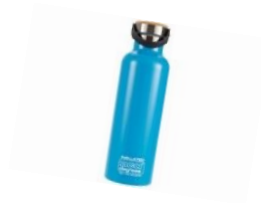
z.B. SEA TP SUMMIT 360° Trinkflasche