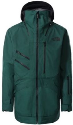
z.B. THE NORTH FACE Steep Series Futurelight