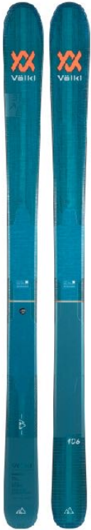
z.B. VÖLKL Blaze