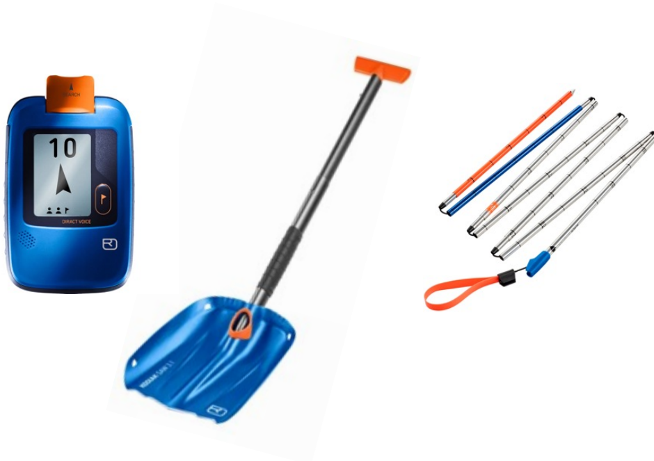
z.B. ORTOVOX Direct, Lawinensonde, Lawinenschaufel