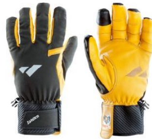
z.B. ZANIER Laserz.TW