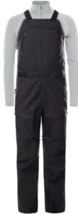
z.B. THE NORTH FACE Steep Series Futurelight