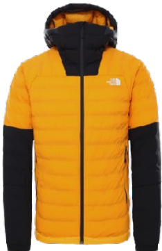
z.B. THE NORTH FACE Summit Series 50:50 Down Jacket