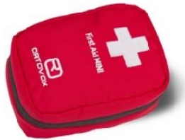
z.B. ORTOVOX 1.Hilfe Set/Reiseapotheke