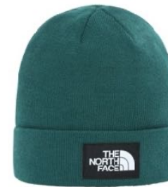
z.B. THE NORTH FACE Recycelte Dock Worker Mütze