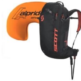
z.B. SCOTT Patrol E1