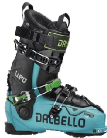
z.B. DALBELLO Lupo