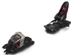
z.B. MARKER Duke PT